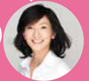
女優・タレント 向井 亜紀さん