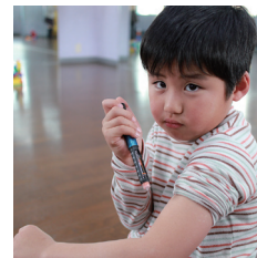
ゆうきくん本人ではありません (プライバシー保護)

小学校4年生 ゆうきくん ぼくが1型になったのは2年生の夏です。今は注射することになれてきたけど、はじめのころはなんで注射しなきゃいけないのかわかりませんでした。1型が治ったら注射がなくなるし、低血糖*の心配もなくなるし、友達と食べたいときにお菓子とかを自由に食べられます。大人になったら病院代がすごくかかると聞いてきました。それもなくなれば嬉しいです。 *インスリンが効きすぎると血糖値が下がり意識を失う場合があります。