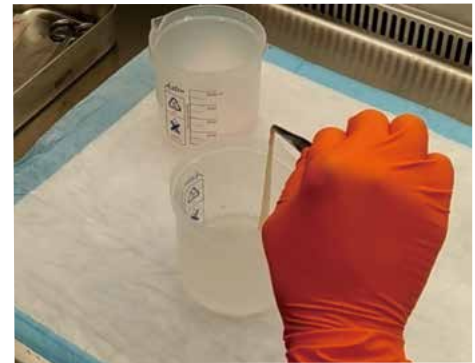
分離した羊膜上皮細胞

移植した細胞が正常に機能することを生着といいます。細胞移植の共通課題である生着について解析を行い、移植の際に補体第5因子と呼ばれるタンパク質を阻害して早期炎症反応を抑制することで、膵島の生着を促進し得ることを明らかにしました。羊膜上皮細胞の生着向上について解析を進めていきます。