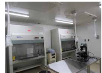
細胞加工施設の内部写真