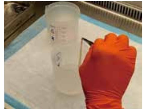
分離した羊膜上皮細胞

移植した細胞が正常に機能することを生着といいます。細胞移植の共通課題である生着について解析を行い、移植の際に補体第5因子と呼ばれるタンパク質を阻害して早期炎症反応を抑制することで、膵島の生着を促進し得ることを明らかにしました。羊膜上皮細胞の生着向上について解析を進めていきます。